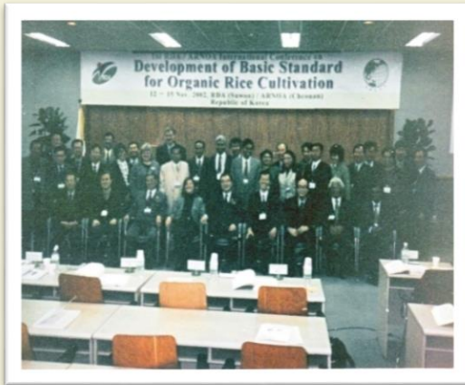
At the International Conference in South Korea - 2002