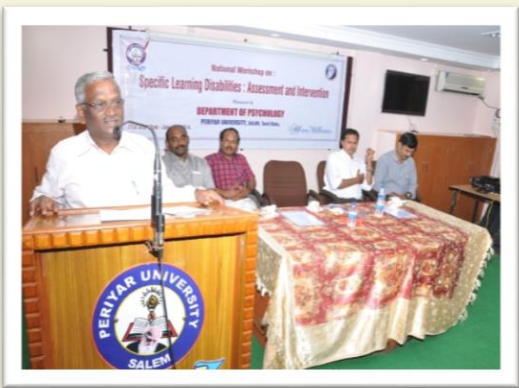
Valedictory Address at the Workshop in the Psychology Department - 2014