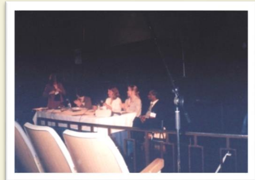
Paper Presentation at Ryerson University in 2004 - Canada