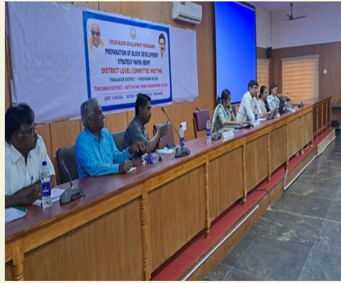
With State Planning Commission Member and District Collector for BDSP project