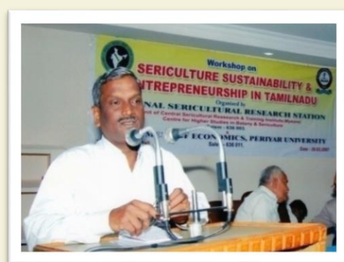
Workshop on Sericulture Sustainability and Entrepreneurship - 2007