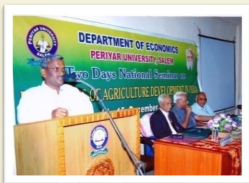
Seminar on Dimensions of Agriculture Development - 2006