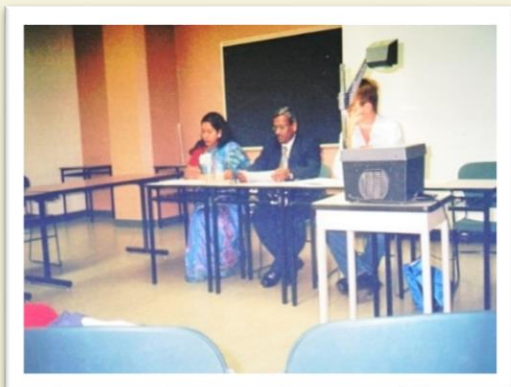
International Conference in Philippines - 2007