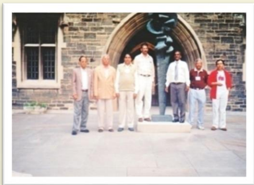
Visit to Toronto University - 2004