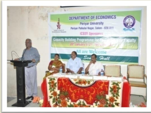
Address at the ICSSR's Capacity Building Programme for Social Science Faculty - 2014