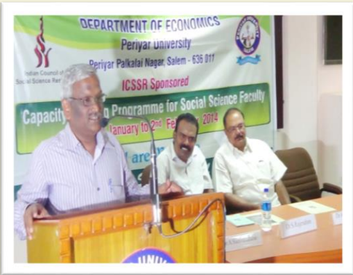
Valedictory Function of ICSSR Training Program - 2014