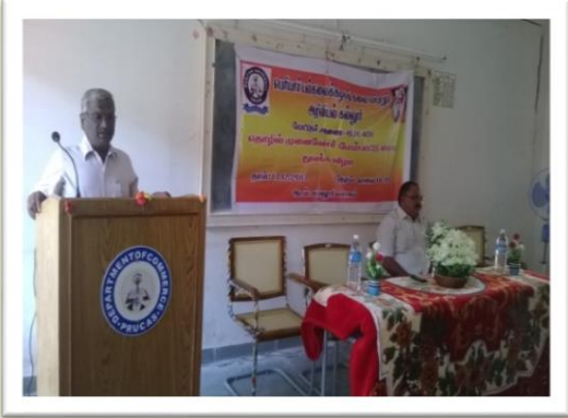
Special Address at the Periyar University Constituent College, Mattur - 2013