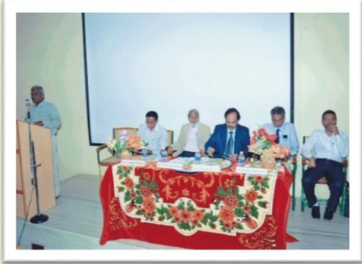
Welcoming the Vice-Chancellors - 2012