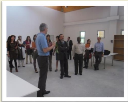
Academic Discussion in Spain - 2011