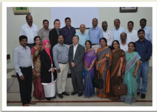
With Delegates of 8 th ICA-AP International Conference- 2013