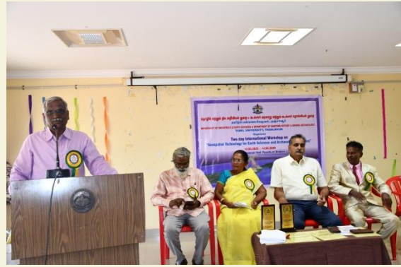
Tamil University - International Conference- 2025