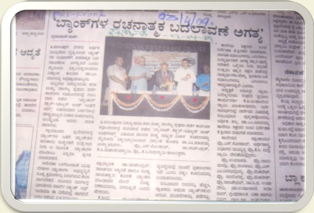
Releasing Souvenir T. Narasipura – 2009