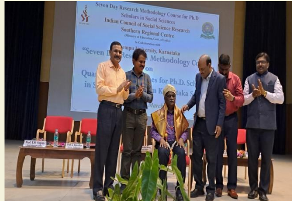
Honored at Kuvempu University- 2025