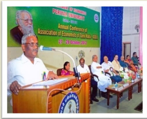
Presidential Address at the XXXIII AET Annual Conference - 2012