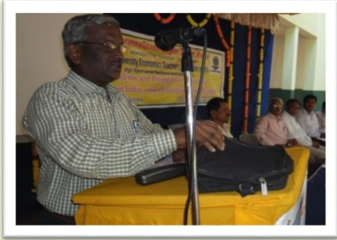
Special Address at Maddur – 2010