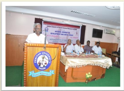
Special Address at the Sociology Department - 2014