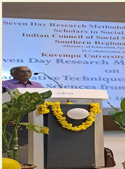
Presidential Address at Kuvempu University- 2025