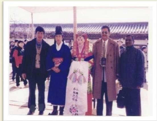
Visit to a Village in Seoul - 2002