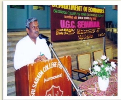
Addressing a Seminar at Sri Sarada College - 2006