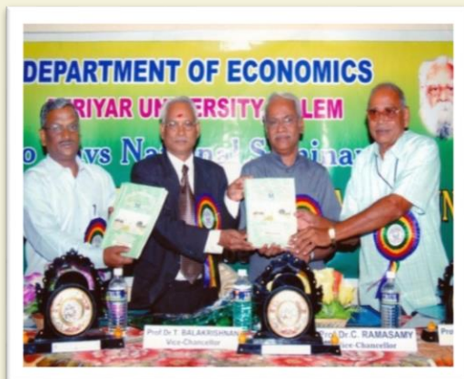
During the National Seminar - 2006