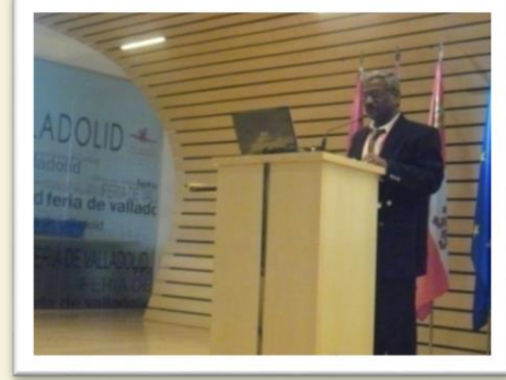
International Conference at Spain - 2011