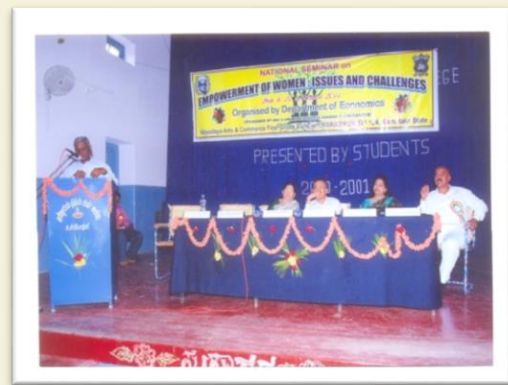
Valedictory Address at Vidyaodaya College, T.N. Pura - 2011