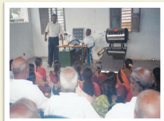
At a Training Programme on Energy in Pannavadi Village - 2007