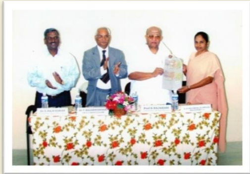
At the First Endowment - 2006