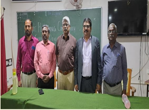
With State Planning Commission Member