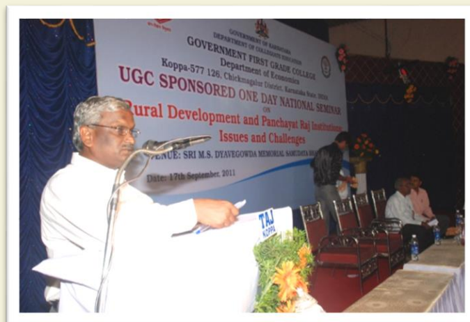
Special Address at a Seminar in Chickmagalur – 2011