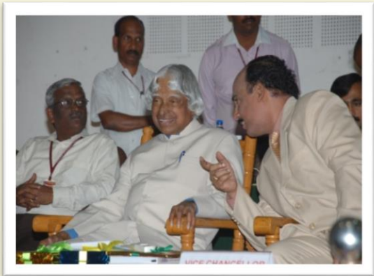
At a function with former President of India - 2013