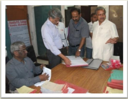
NAAC Visit - Handia Post Graduate College, Allahabad - 2013