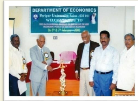
At a National Level Seminar - 2006