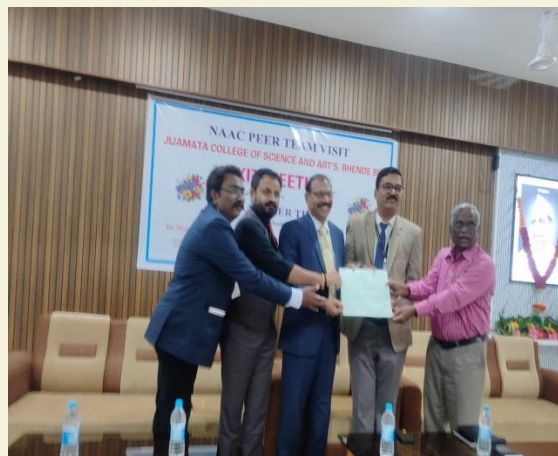
NAAC- PTV Bhende College- 2025