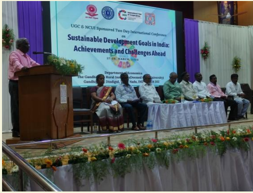
GRI-ECO - International Conference- 2025