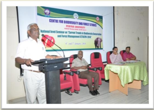
Valedictory Address at the Centre for Biodiversity and Forest Studies - 2014