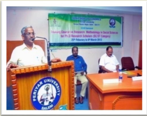
ICSSR sponsored Workshop - 2013