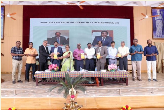
Release of Pulse Book- 2025